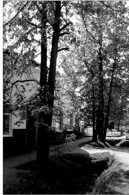
Свечинское райпо обновляет фасады зданий в едином стиле.

- Со всех запланированных улиц центральной части поселка мусор был вывезен. Но в график машина укладывалась не всегда, так как жители выставляли на обочины не только мешки с мусором, но и старую мебель,