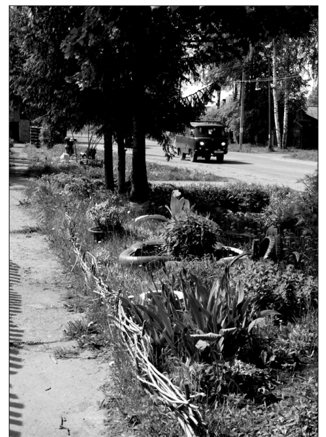
Жители поселка благоустраивают территорию около своих домов.

строительные отходы и др. При этом никто не вышел помочь работникам, грузившим все это. Мало того, кучки мусора вновь появлялись через некоторое время. Таким образом, машина вынуждена была проехать по каждой улице дважды, что повлекло лишние расходы из и так небогатого бюджета поселения. По прилегающим и окраинным улицам техника работала по заявкам жителей.