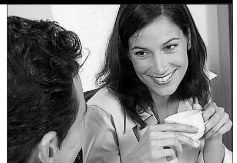
Страничку подготовила Ирина Константинова