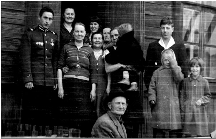
Жильцы дома № 2 улицы Вокзальной. Фото начала 60-х годов.