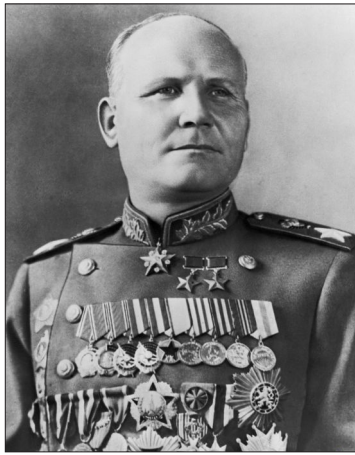
Мемориальный дом-музей И.С. Конева