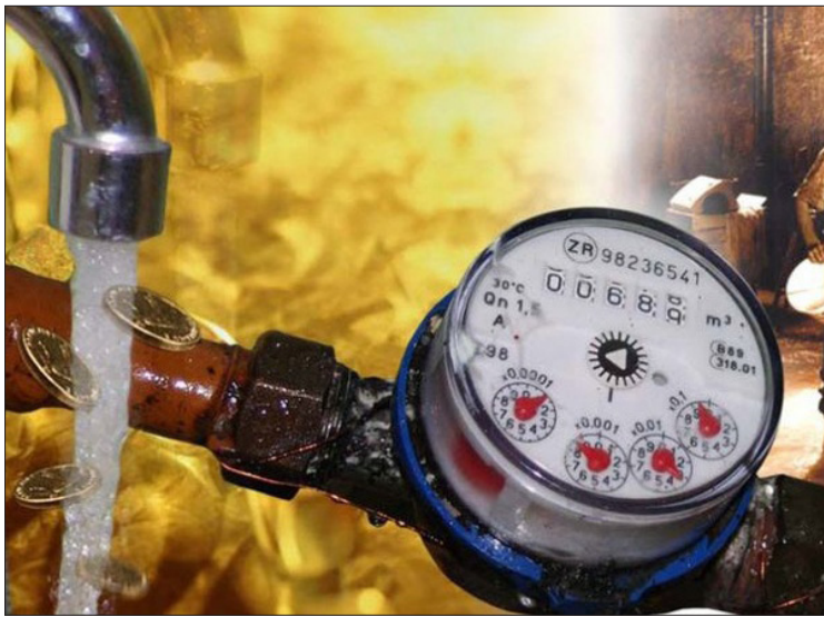
Приборы учета помогут снизить расходы на коммунальные услуги.

Впервые утвержден норматив потребления холодной воды на полив участка из рас-