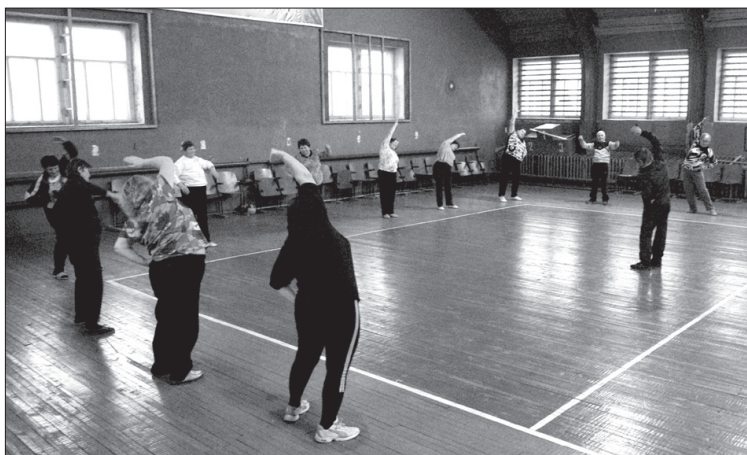
В спортивном зале Свечинского сельского КСК ветераны получают хороший заряд энергии.

Для ветеранов-любителей заниматься физкультурой и спортом в нашем поселке организованы и работают три группы здоровья, в каждой из которых по 9 - 13 человек. Одна группа проводит занятия в красном уголке конторы дорожного участка, вторая - в Доме творчества, а третья, открытая в начале октября этого года, - в спортивном зале Свечинского сельского КСК.