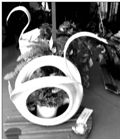
Свечицы делают удивительные клумбы из автомобильных покрышек.