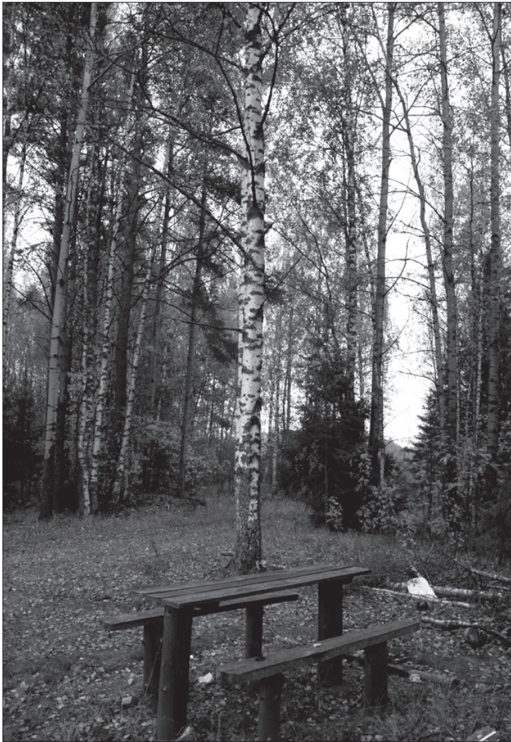
А золотые листья вянут, с ветвей срываются ветром.