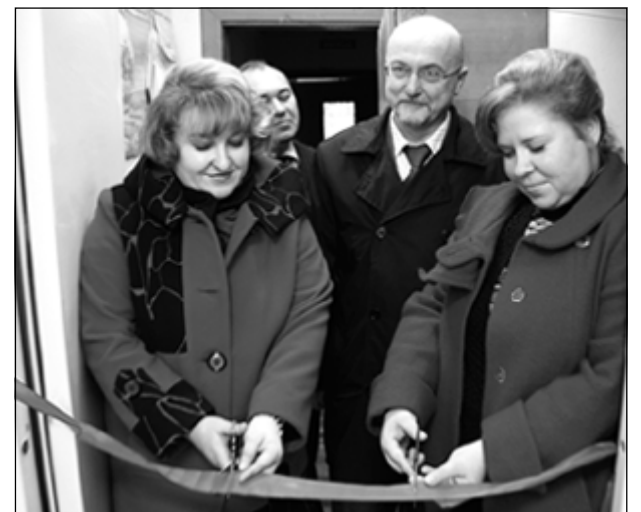
Открытие обновленного ФАПа в селе Ацвеж.

В прошлом году истек срок действия лицензий на предоставление медицинских услуг фельдшерско-акушерских пунктов Свечинского района. Новые требования оказались достаточно жесткими, и, чтобы помещения ФАПов привести в соответствие с санитарными нормами и правилами, необходимы были немалые средства. В этом году по программе модернизации здравоохранения МУЗ «Свечинская ЦРБ» были выделены средства на ремонт некоторых ФАПов района.