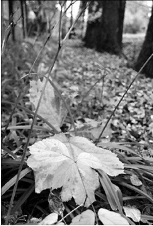
Прощаясь с последним осенним теплом, Октябрь улыбнулся упавшим листом.