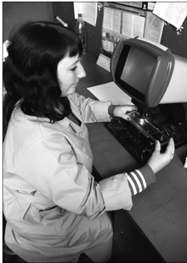
В этом году ветстанция приобрела новое оборудование для исследования мяса диких животных.

В этом году в нашей стране появился еще один православный праздник - Патриарх Московский и всея Руси Кирилл объявил покровителями ветеринаров Флора (Фрола) и Лавра и установил 31 августа церковный праздник ветеринаров. В этот день в Кировской области впервые был проведен региональный праздник, посвященный Дню ветеринаров.