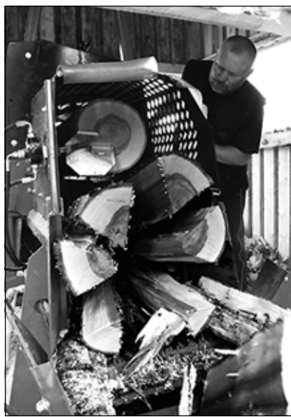
Колотые дрова – одна из самых востребованных услуг перед началом отопительного сезона.

В настоящее время ООО «Свечинский лесбизсервис» производит в основном брус и доску обрезную различных размеров и сечения по заказу потребителей, а также обеспечивает предприятия, учреждения и население района дровами. Кроме того, в этом году предприятие приобрело агрегат по распиловке и колке дров финского производства – дрово-