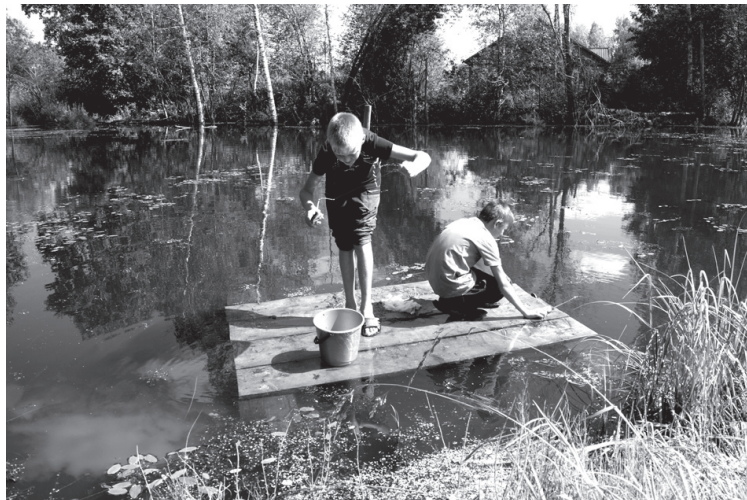
Ловись, рыбка, большая и маленькая...

Редакция не несет ответственности за изменения в телепрограмме.