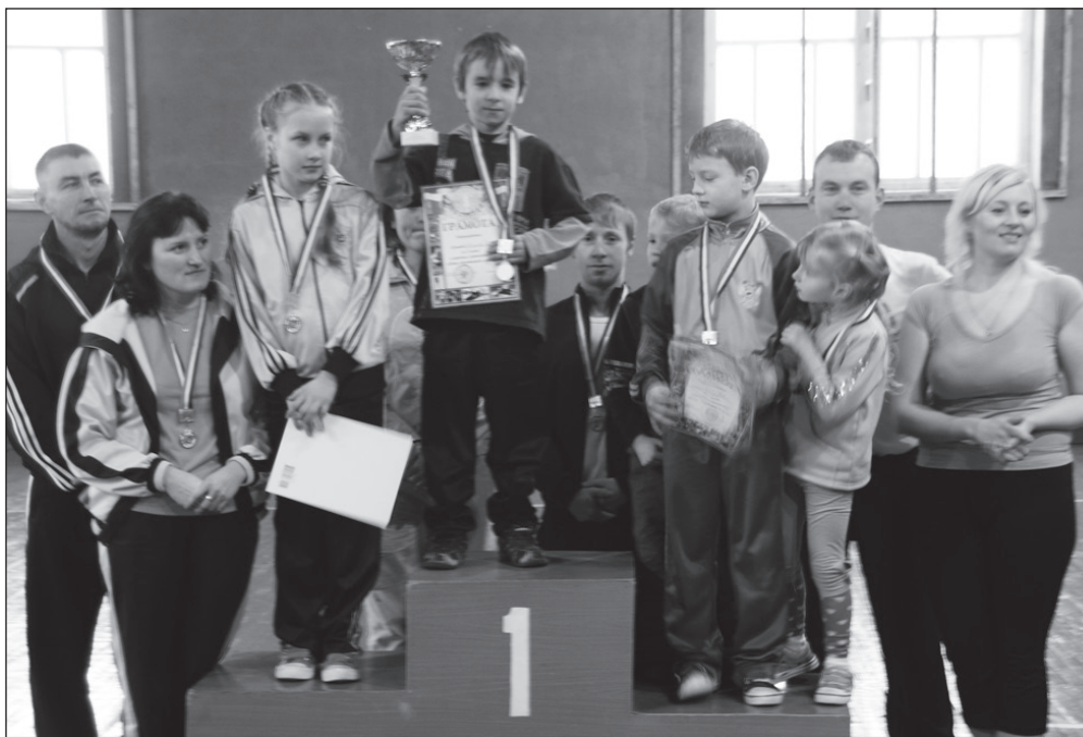
На пьедестале почета - команды-победительницы; этапы спортивно-го состязания.

Первый этап - круговая эстафета, в которой, как правило, участвует вся команда. Эта форма соревнований наиболее зрелищна, а главное в ней должна быстро и безошибочно отработать